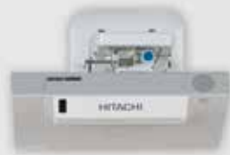
Abbildung zeigt: PTMFT1913 mit Hitachi Projektor und Fingertouch-Modul