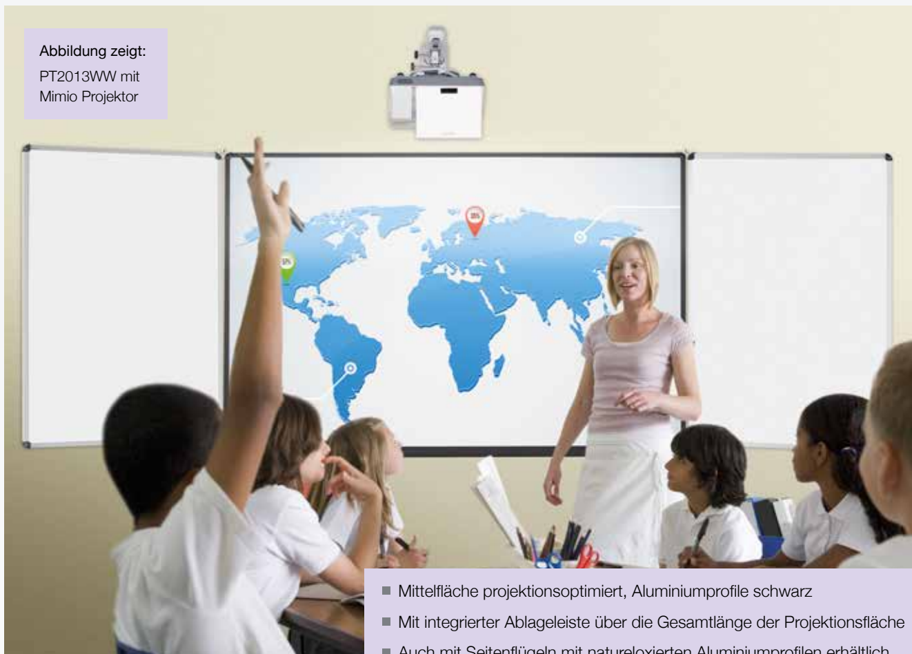
Abbildung zeigt: PT2013WW mit Mimio Projektor

Projektionstafel mit matter Tafeloberfläche, magnethaftend und trocken abwischbar