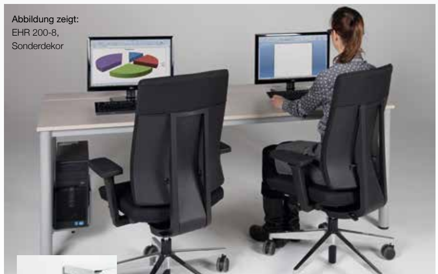
Abbildung zeigt: EHR 200-8, Sonderdekor