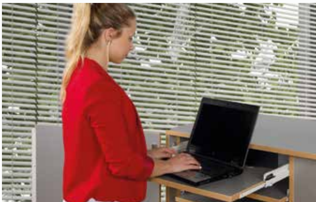
Wahlweise mit Teleskopauszügen oder Einlegeböden