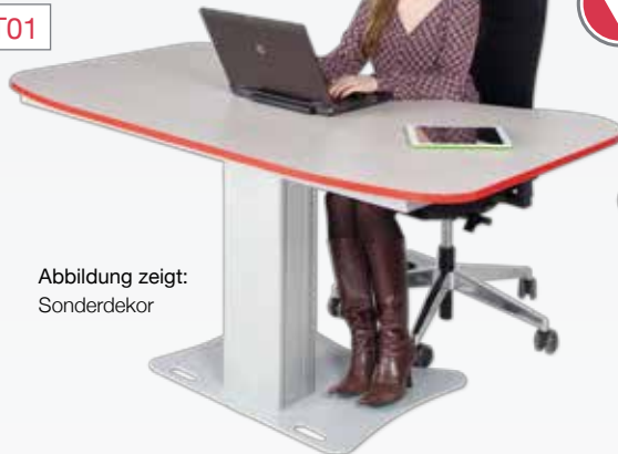
Abbildung zeigt: Sonderdekor