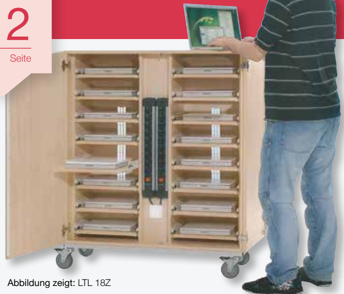
Abbildung zeigt: LTL 18Z