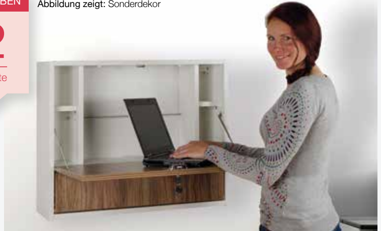
Abbildung zeigt: Sonderdekor