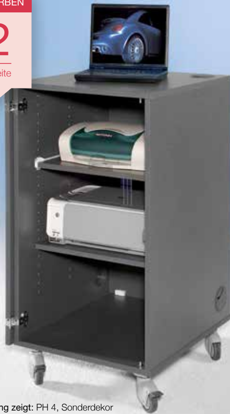
Abbildung zeigt: PH 4, Sonderdekor