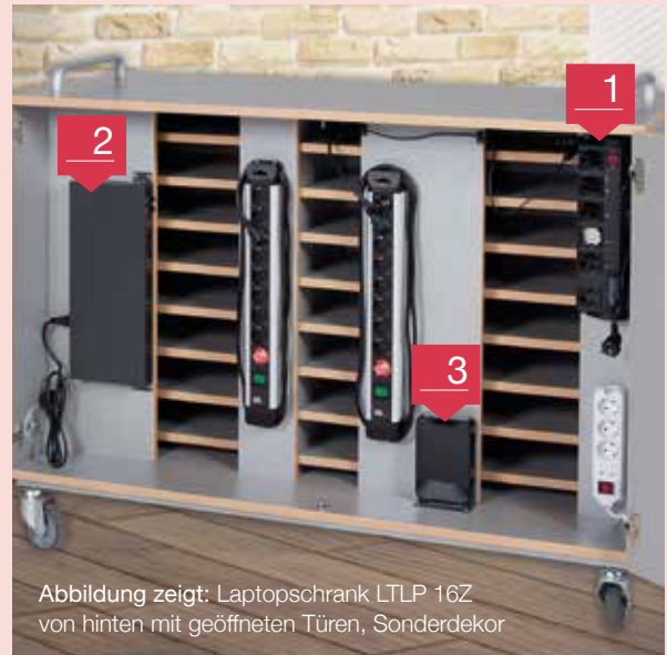
Abbildung zeigt: Laptopschrank LTLP 16Z von hinten mit geöffneten Türen, Sonderdekor