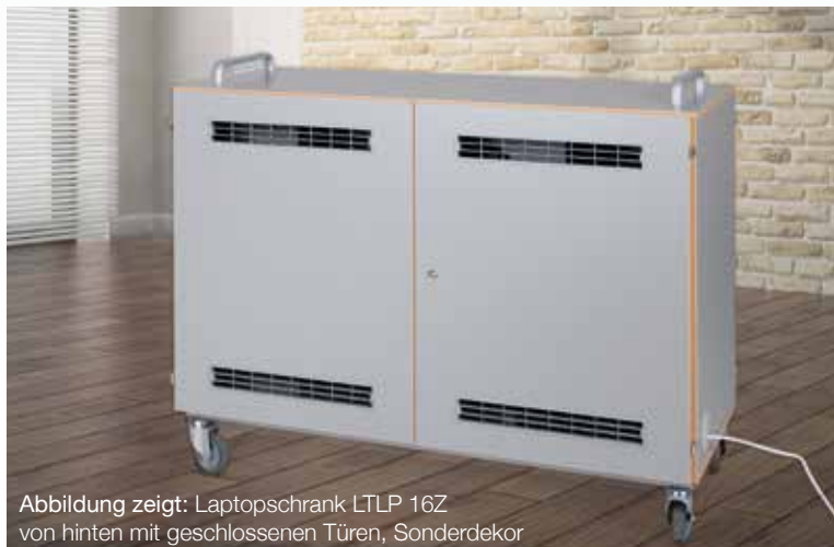
Abbildung zeigt: Laptopschrank LTLP 16Z von hinten mit geschlossenen Türen, Sonderdekor