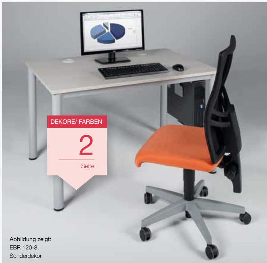
Abbildung zeigt: EBR 120-8, Sonderdekor