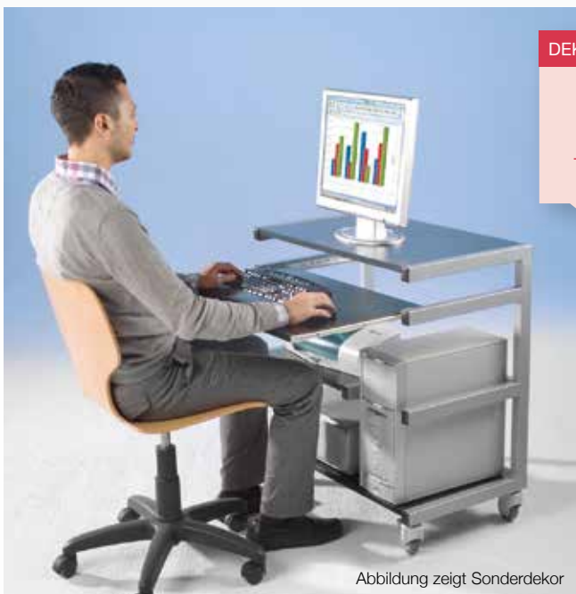
Abbildung zeigt Sonderdekor