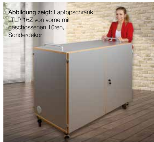
Abbildung zeigt: Laptopschrank LTLP 16Z von vorne mit geschlossenen Türen, Sonderdekor