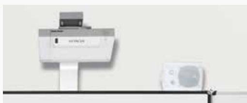
Mit Halterung SM-HDL