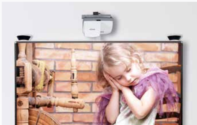
Mit Halterung SM-HDBL