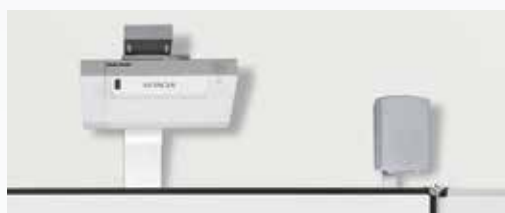
Mit Halterung SM-HDT